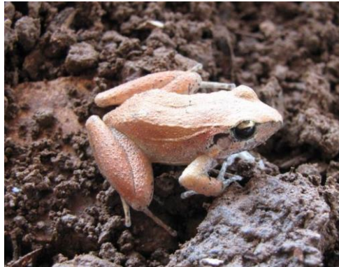
Figura 1 – Exemplar de Barycholos ternetzi (Miranda-Ribeiro, 1937); Anura, Craugastoridae.

Lynch 19,21 . Foi considerado sinônimo de Barycholos savagei (21) por Caramaschi e Pombal Jr. (19) . Atualmente pertence a família Craugastoridae e possui um único congênera, Barycholos pulcher ocorrente apenas nas planícies do Equador (22) . É comumente encontrado em ambientes florestais, tais como matas de galerias e matas mesófilas (19) e possui hábitos preferencialmente noturnos.